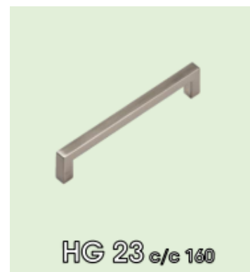
HG 23 c/c 160