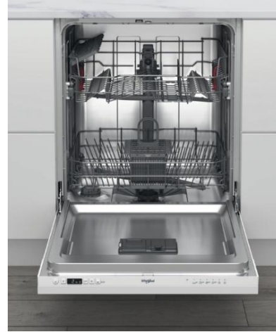
WIC 3B19 - Integrert oppvaskmaskin