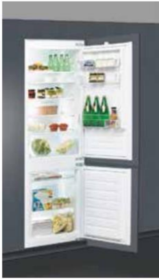
ART 66011 Integrert kombiskap