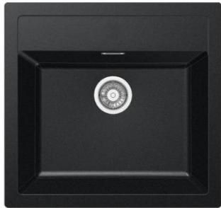
Sirius SID 610-50 TH Tectonite Carbon Black