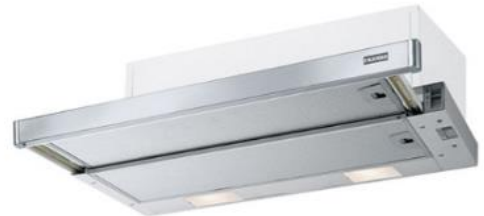
Flexa FTC 632L GR/XS Rustfritt stål