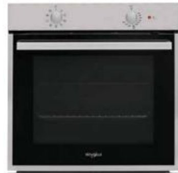
OA 2N8F D IX - Ovn - Absolute Gallery