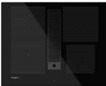
WVH 1065B F KIT