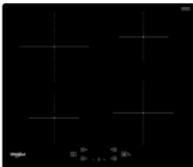
WS Q2160 NE Induksjonstopp